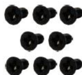
M3x6L 螺絲 x 8