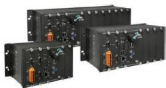
LX-9171 LX-9371 LX-9771