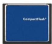
CF 插槽 配一 CF 卡