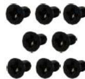
M3x6L Screw * 8